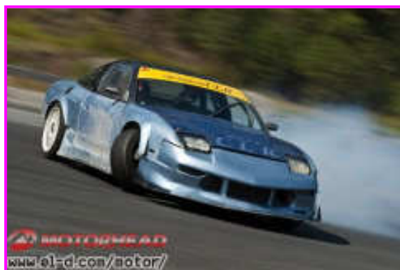
スピード感たっぷり！ さすがモーターヘッドさん！