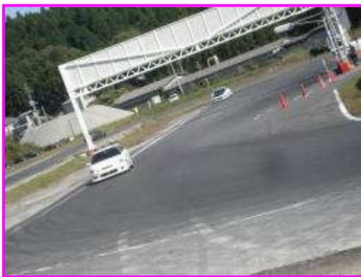
ホームストレート～1コーナー進入 ひろ~~~~~いいい!

もう、自分のペースというのも決まってきた頃だと思います。さてそこで自分の苦手な所ってあると思いますが、どうやって練習していますか？走行会っていろんな方が思い思いに走ってますよね。他の方の走行を見て学んだり、イメトレも大事ですよ。せっかく日光さんに来たのですから、1～3・8～10(バックストレッチ)もいろんなアプローチで走ってみましょう！目線の置き方(取り方)や縁石の使い方も日光で可能になりました！縁石を使えてくると、もっともっと楽しいと思いまーす！