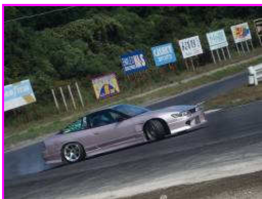
1～2へ向かうところ！ きもちよさぞ♪

今の自分の課題はありますか？楽しく走る！ココをつなぐ！などたくさんあると思います。車種にもよりますが 1～6・8～10を3回振りでつなげる!! などそれぞれのレベルでチャレンジ中だと思います！目線・ライン取りいろいろ試行錯誤して楽しんでゆきましょう！「上手な方のアクセル音」ってとっても参考になりますよね♪