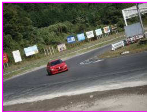
別角度から 1～2コーナーへ ひろ~~~~~いいい!